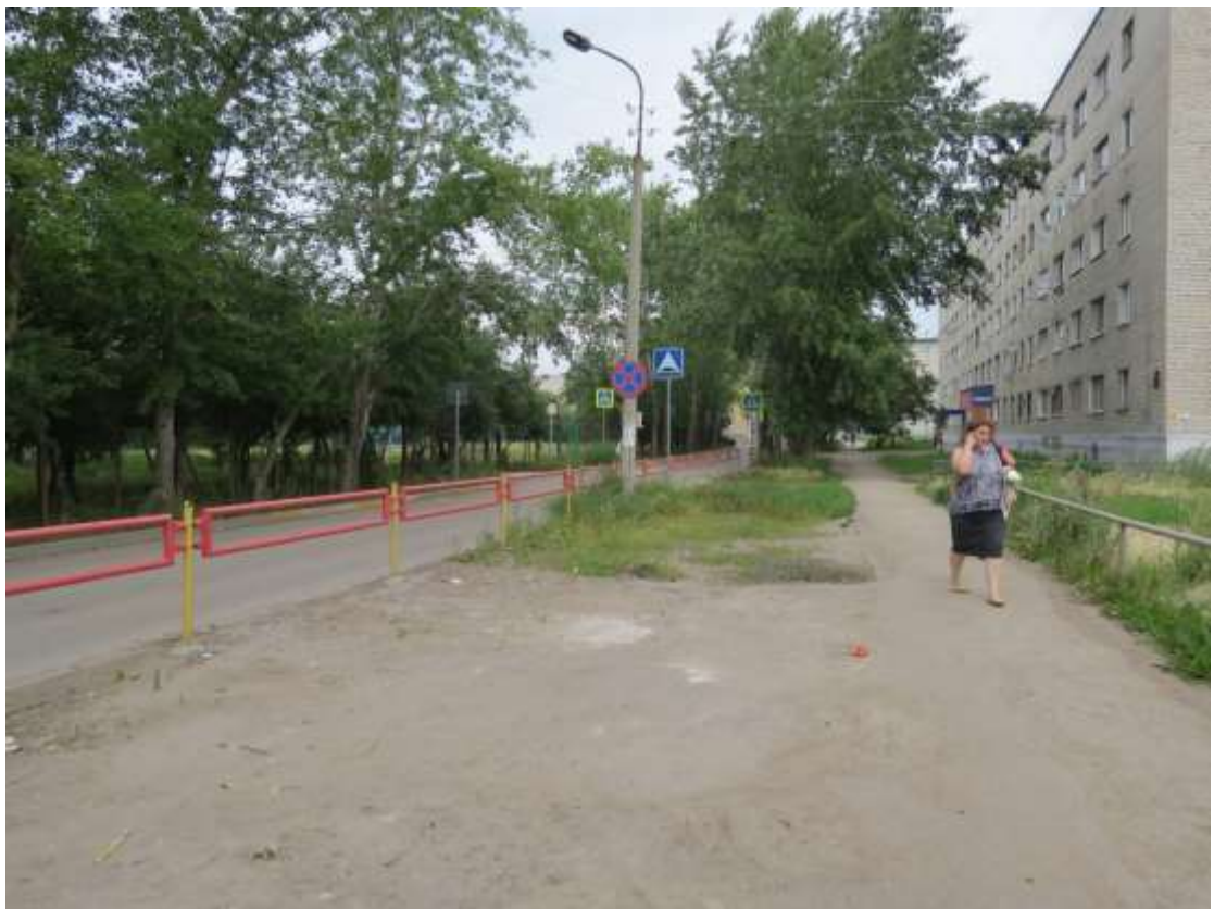
Нерегулируемый пешеходный переход у северо-восточных ворот школы