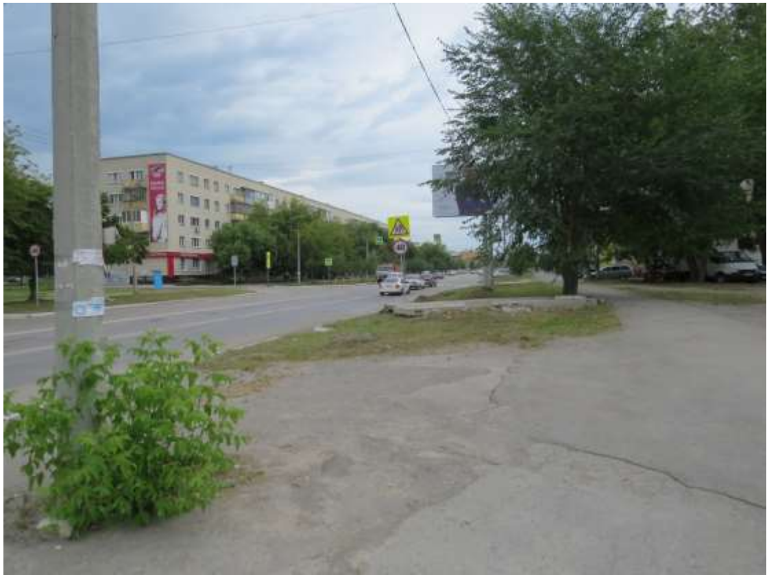
Нерегулируемый пешеходный переход по улице Кунавина