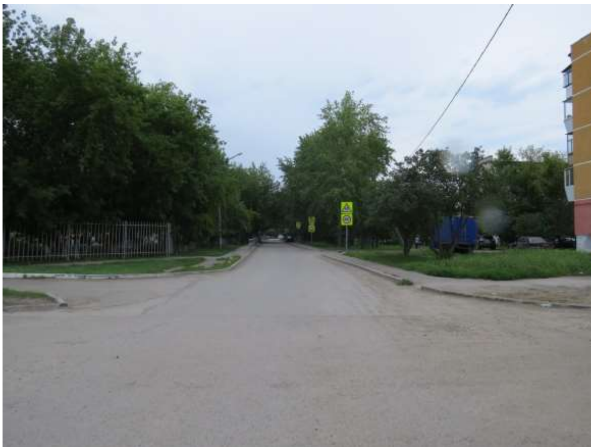
Опасный участок улицы Кирова у дома №11