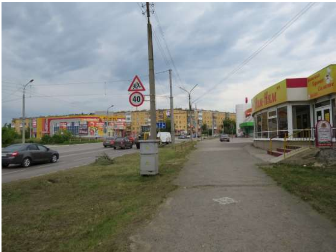
Регулируемый пешеходный переход перекрестка улиц Кирова – Кунавина