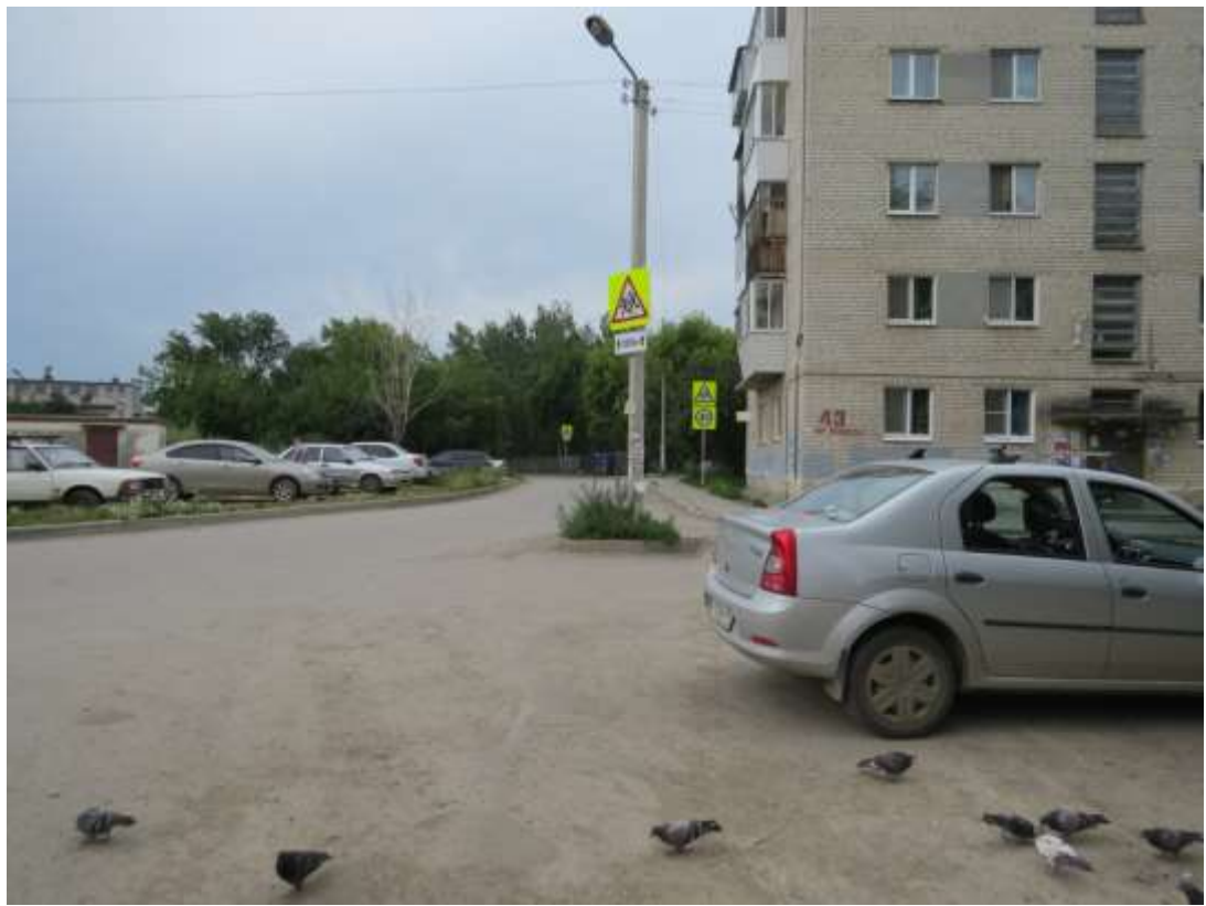
Нерегулируемый пешеходный переход у северо-западных ворот школы