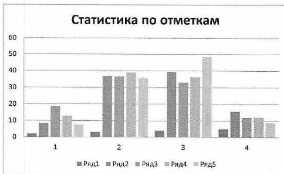
Рисунок 6. Гистограмма статистики отметок среди учеников 5 класса 2022-2023 уч.года

Из диаграммы видно, что результаты учеников Средней школы №22 превышают средних результатов среди школ Свердловской области и города Каменск-Уральского.