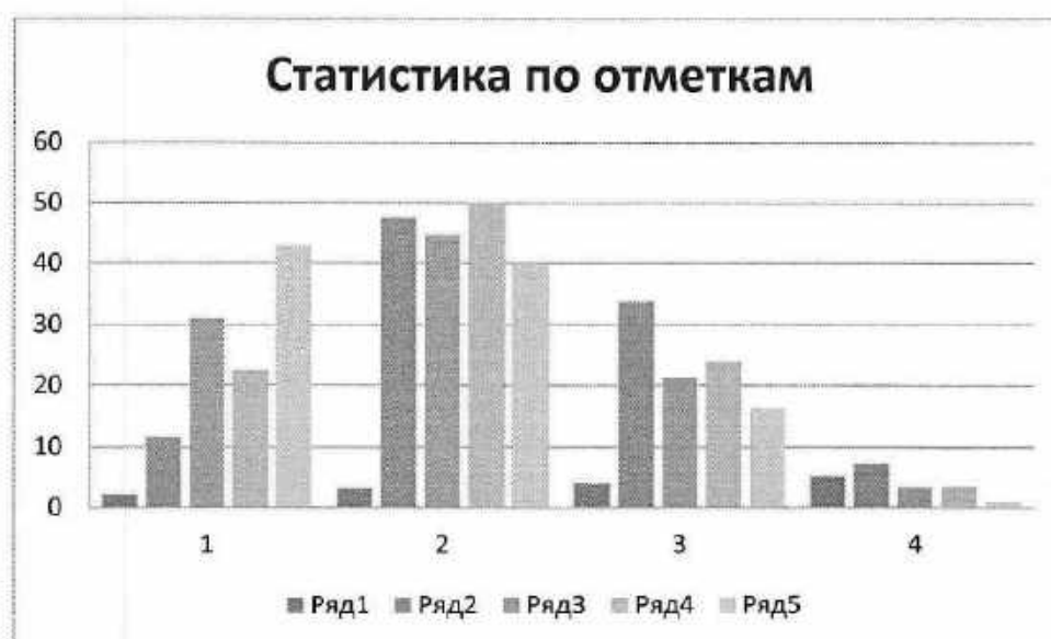
Рисунок 7. Гистограмма статистики отметок среди учеников 6 класса 2022-2023 уч. года