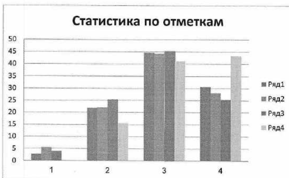
Рисунок 5. Гистограмма статистики отметок среди учеников 4 класса 2022-2023 уч.года

Из диаграммы видно, что результаты учеников Средней школы №22 превышают средний уровень результатов среди школ Свердловской области и города Каменск-Уральского.